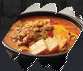
Brisket Bean curd Soup