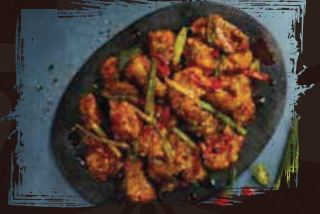
Fried Soy sauce Chicken