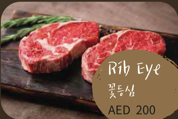
Rib Eye 꽃등심 AED 200