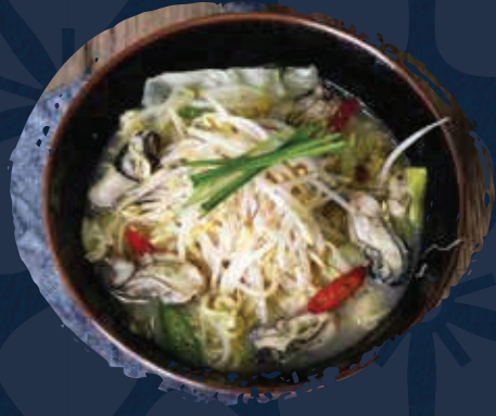
Oyster Noodle المعكرونة المحار AED 110