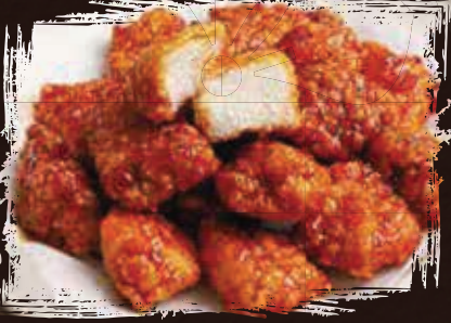
Boneless Spicy Chicken