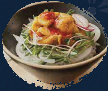
Sea Pineapple Rice أرز أناناس المأكولات البحرية AED 99