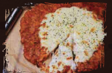
Kimchi Cheese Pancake