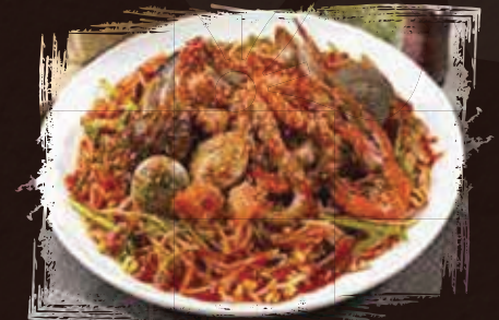
Stir Fried mixed Seafood