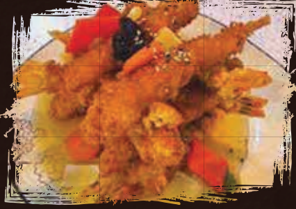
Kampung Shrimp Tower