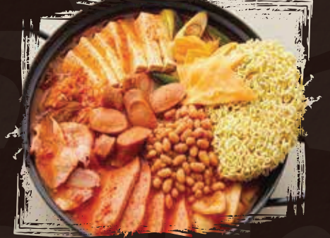
Budae Stew بوداي يخنة AED 185