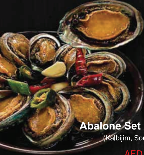
Abalone Set مجموعة أذن البحر (Kalbijim, Soup, Ston rice)