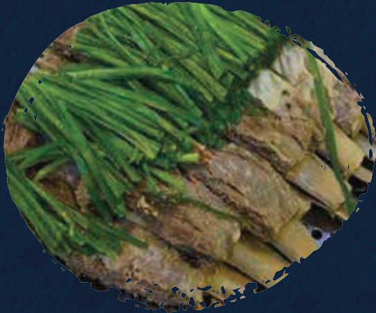
Braised Lamb Chop قطعة لحم ضأن مطهوه ببطء