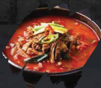
Spicy Beef Soup