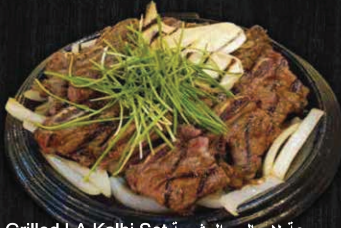
Grilled LA Kalbi Set مجموعة لا جالبي المشوية (Grilled Beef, Soup, Ston rice)