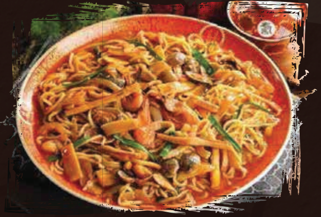
Tray Stir fry Jampong