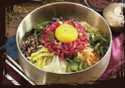
Raw Beef mixed Rice أرز مختلط باللحم البقري النيئ