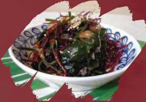
Cuttlefish Seaweed Salad سلطة الحبار بالأعشاب البحرية