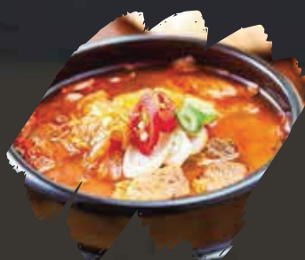
Tuna Kimdar Soup