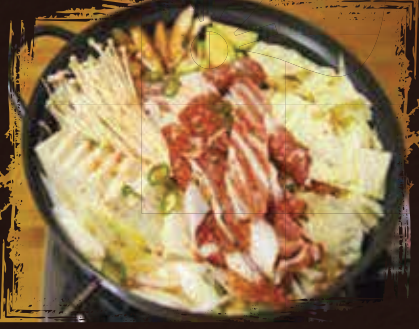
Brisket Bean Curd Stew يخنة بريسكيت الفول الرائب AED 185