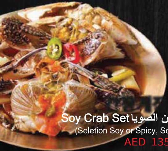
Soy Crab Set مجموعة سلطعون الصويا (Seletion Soy or Spicy, Soup, Ston rice)