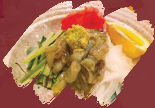
Taco Wasabi Salad سلطة تاكو واسابي