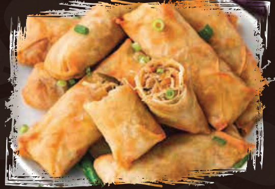
Veg Spring Roll سبرينغ رول نباتي AED 55