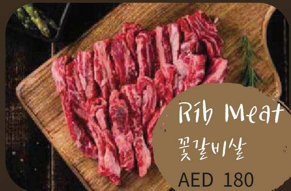
Rib Meat 꽃갈비살 AED 180