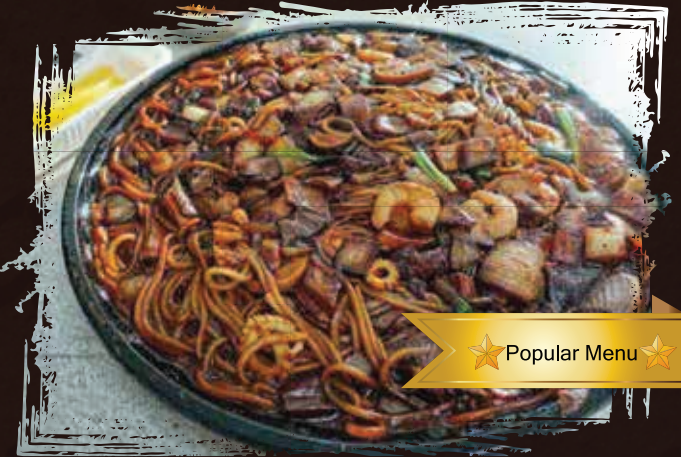
Tray Jajang myeon