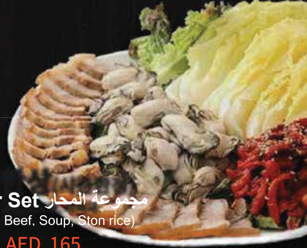
Oyster Set مجموعة المحار (Brasied Beef, Soup, Ston rice)