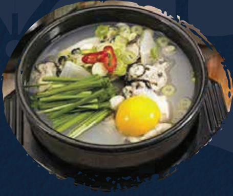
Oyster Soup حساء المحار AED 110