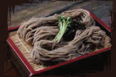
Zaru Soba زارو سوبا