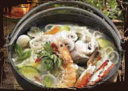
Seafood Flat Noodle