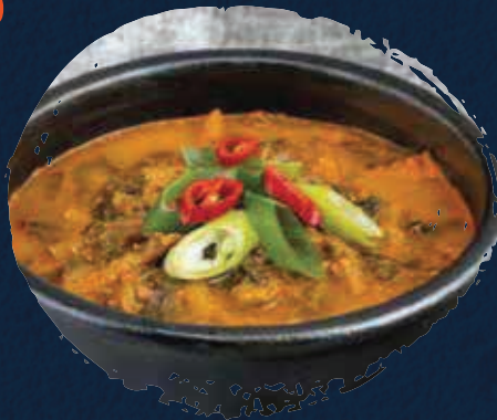
Eel Soup حساء ثعبان البحر AED 95

Pictures might be different than actual food display