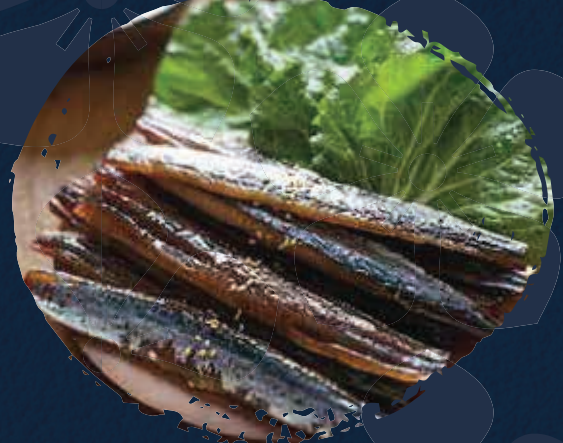
Dried Fish السمك المجفف