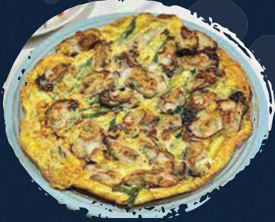
Oyster Pancake فطيرة المحار