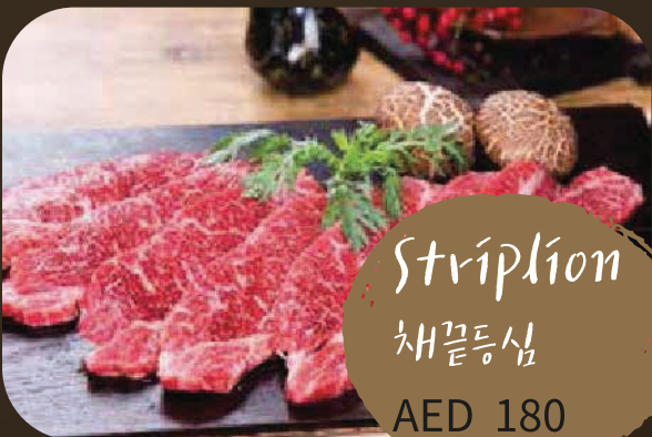
Striplion 채갈뽕심 AED 180