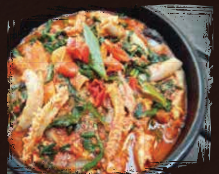
Lamb Stew خروف مطهو