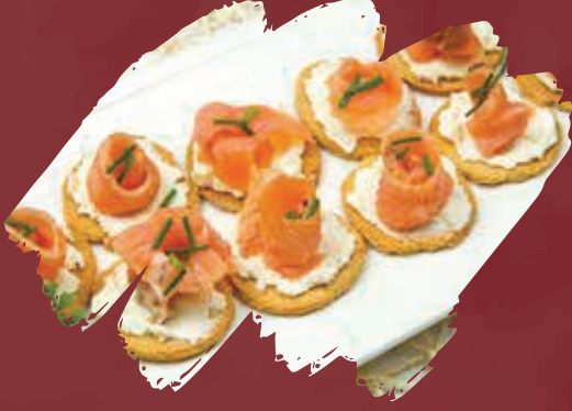
Salmon Canape كانابي السلمون