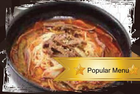
Spicy Beef Flat Noodle