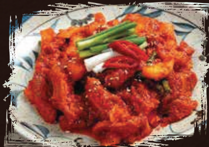
Spicy Skate with Vegetable