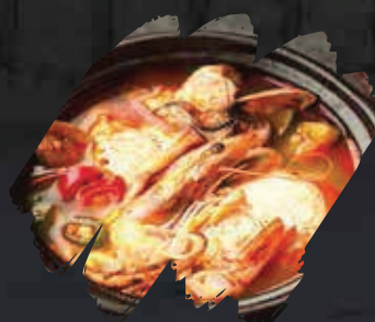
Seafood Soft Tobu Soup