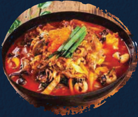
Brisket Noodle المعكرونة بريسكيت AED 110