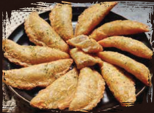
Dumpling زلابية AED 55