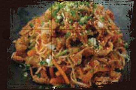
Brisket Bean Sprout