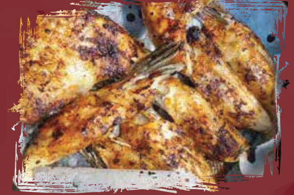
Grilled Salmon Head رأس سلمون مشوي AED 150