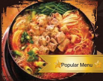
Beef Intestine Stew يخنة أمعاء البقر AED 195