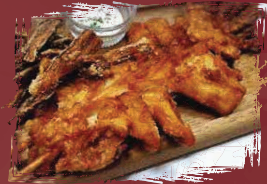
Cuttlefish Karaake الحبار الكارياكي AED 175