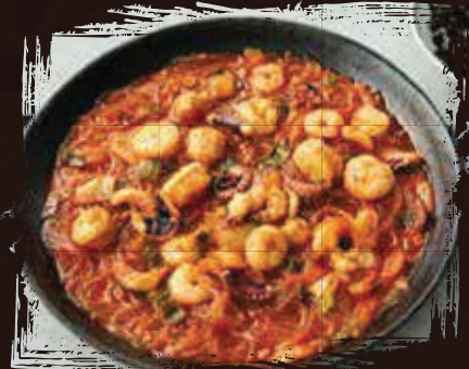
Spicy Octopus Shrimp Stew يخنة الروبيان الأخطبوط الحار AED 250