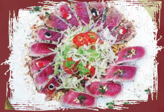
Tuna Tataki تونا تاتاكي AED 135