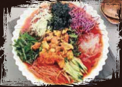
Cold Raw Fish Soup