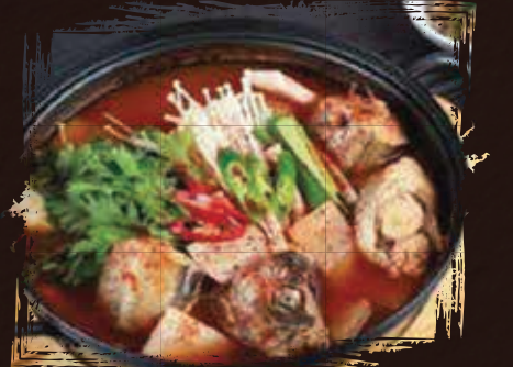
Alaska Pollock Stew يخنة ألاسكا بولوك AED 195