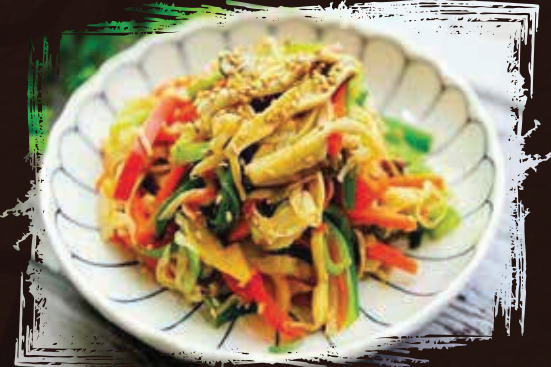
Stir Fry Vegetable AED 55

Selection Morning Glory / Mixed Veg / Bakchoy