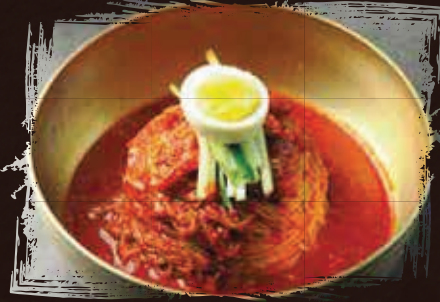
Bibim Naeng Myeon بيبيم ناينج ميون