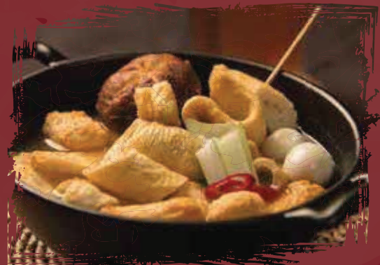
Fishcake Nabe كعكة السمك نابي