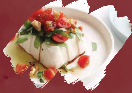
Soft tofu salad سلطة التوفو الناعمة