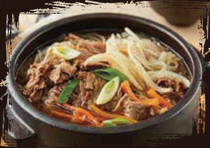
Beef Bulgogi Soup حساء لحم البقر بولجوجي