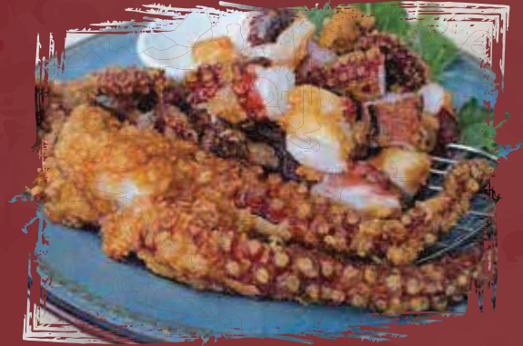
Octopus Karaake الأخطبوط كارياكي AED 185