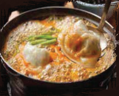
Spicy Dumpling Stew يخنة زلابية حارة AED 195