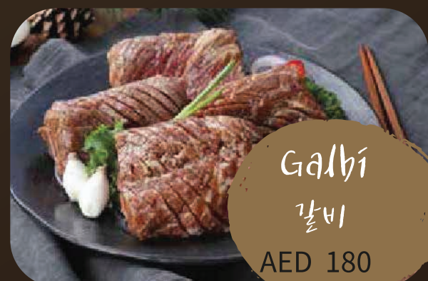
Galbi 갈비 AED 180