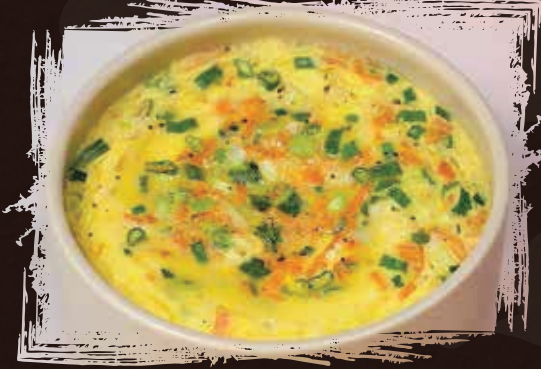
Steamed Egg سبرينغ رول الخضار AED 55