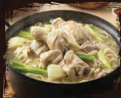
Whole Chicken Stew يخنة دجاج كاملة