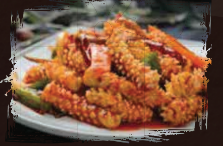
Stir Fry Spicy Octopus or Cuttlefish