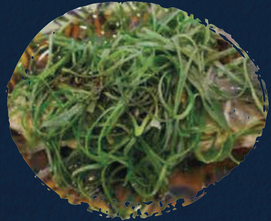
Chinese Style Steamed Hamour هامور مطهوه على البخار على الطريقة الصينية