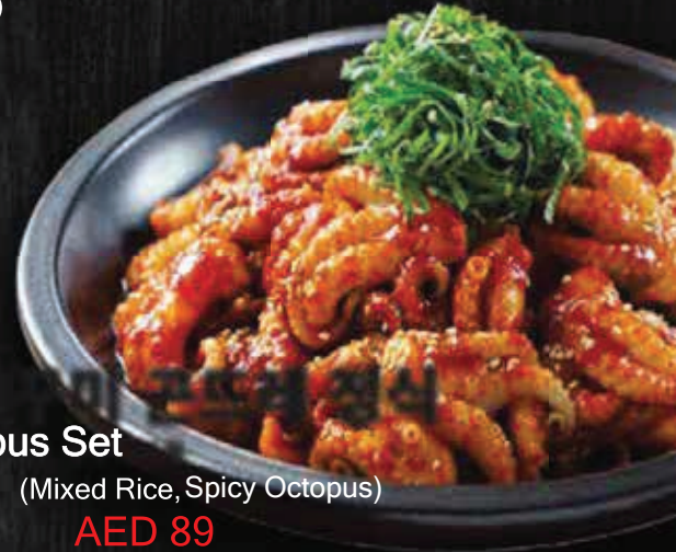
Baby Octopus Set