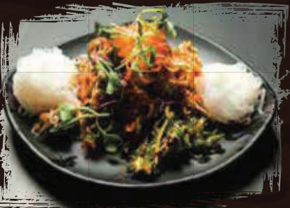
Spicy Whelk with noodle