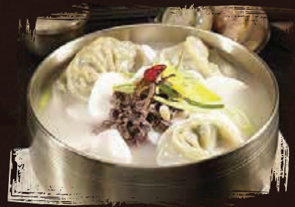
Dumpling Soup حساء الزلابية