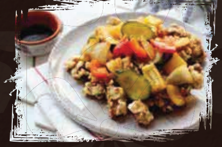
Sweet and Sour Beef