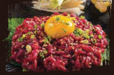
Yuk Hui يوك هوي