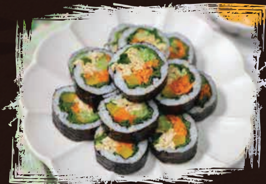
Kimbap AED 55