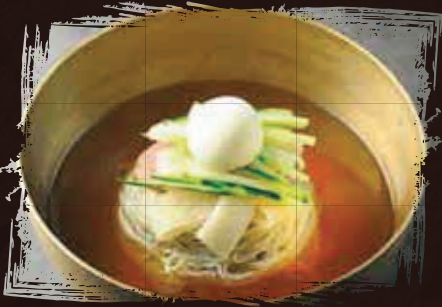
Naeng Myeon ناينج ميون