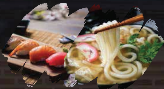
Sushi + Udon