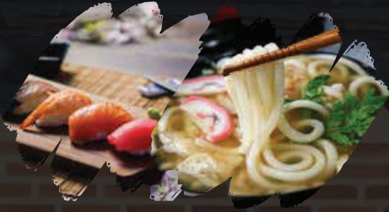
초밥 + 우동