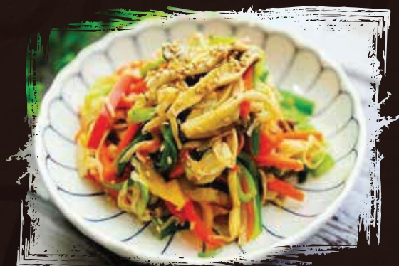
야채볶음 AED 55 (모닝글로리 / 믹스야채 / 청경채)