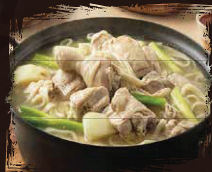
닭한마리 칼국수 전골