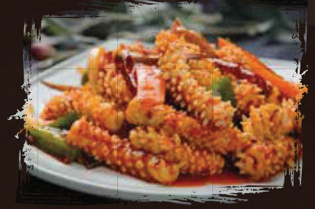
갑오징어 or 낙지볶음