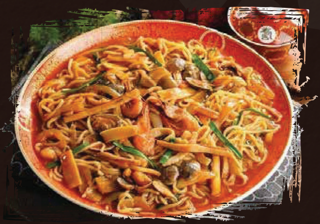
볶음짬뽕 (2인 이상)