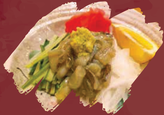
타코 와사비 샐러드